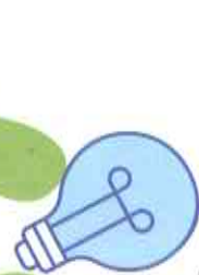
LAMPADINE A FLUORESCENZA